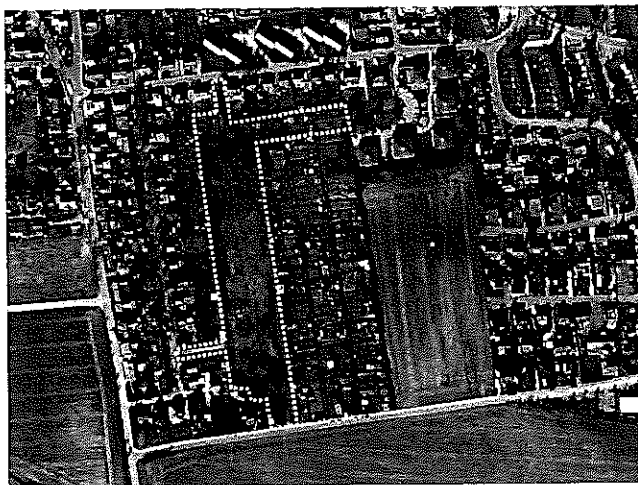
Abb.: DA Nord

Das Plangebiet liegt im Süden der Ortslage östlich der Bebauung Lindenstraße, südlich der Bebauung Am Lindenhof, westlich der vorhandenen Kleingärten und umfasst diverse Flurstücke der Flur 16, Gemarkung Heiligenhafen. Die Fläche präsentiert sich als Siedlungsbrache mit vereinzelt Bäumen im Norden und im Süden. Das Gelände ist stark bewegt und fällt nach Norden deutlich ab. Westlich und nördlich des Plangebietes befindet sich die bebaute Ortslage; direkt östlich grenzen Kleingärten an, weiter östlich ist wiederum Wohnbebauung vorhanden. Die Fläche südlich des Plangebietes zwischen Carl-Maria-von-Weber-Straße und Autobahn wird landwirtschaftlich genutzt.