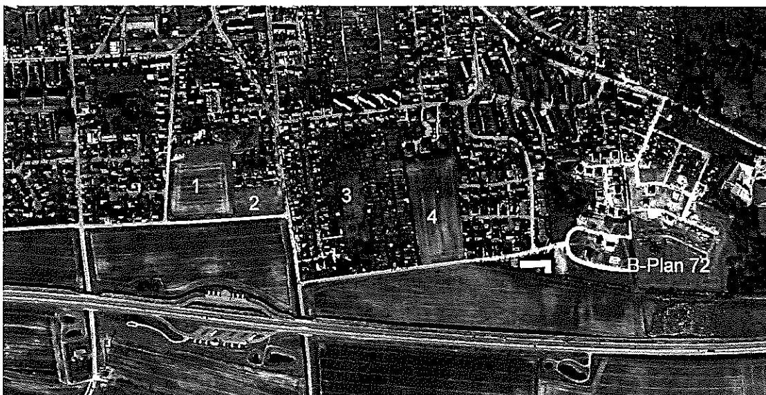
Abb.: DA Nord

In der Stadt Heiligenhafen besteht trotz des sich abzeichnenden demographischen Wandels aufgrund der wachsenden Einwohnerzahlen ein großer Bedarf an Bauland. Der gewählte Standort folgt den Darlegungen der Regionalplanung 2004 für künftige Wohnbauentwicklungen im Süden und Westen und entwickelt sich aus Landschaftsplan und Flächennutzungsplan. Innenentwicklungspotenziale nennenswerten Umfangs stehen nicht zur Verfügung. Die Stadt betreibt bereits eine Vielzahl von Bauleitplanungen mit dem Ziel der Nachverdichtung. Im östlich gelegenen Geltungsbereich des Bebauungsplanes Nr. 72 sind nahezu alle Grundstücke veräußert und größtenteils bebaut (Das Luftbild gibt hier nicht den aktuellen Stand wieder).