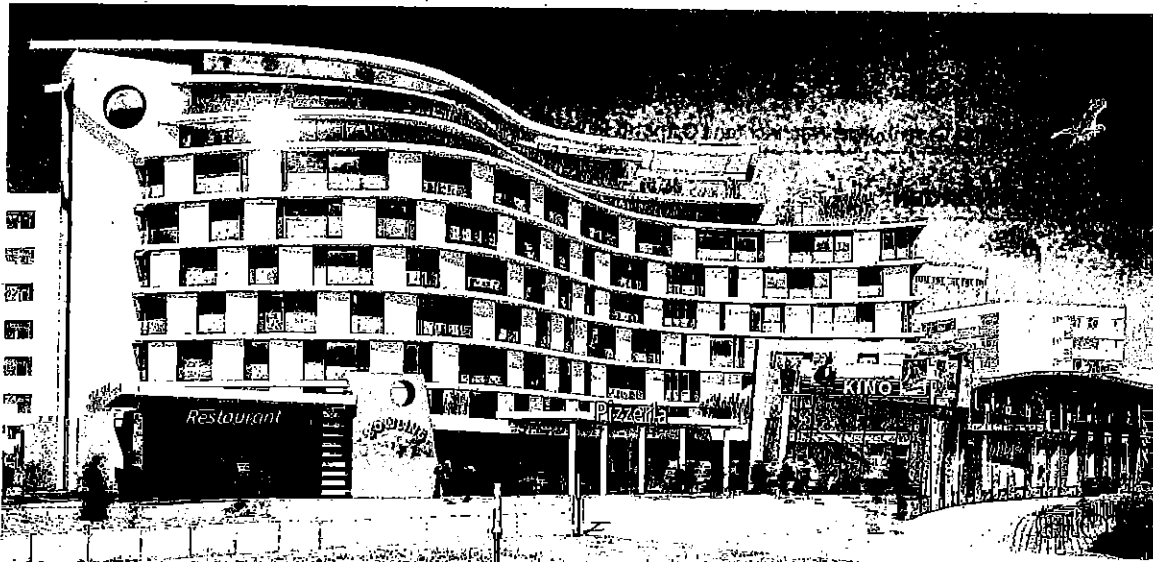
Dieser Entwurf zeigt die Planung von Bünning Immobilien am Ferienzentrum in Heiligenhafen.